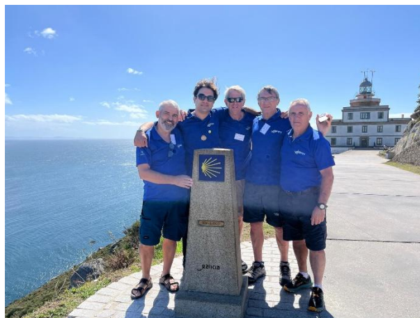
L'équipe de la Savoie