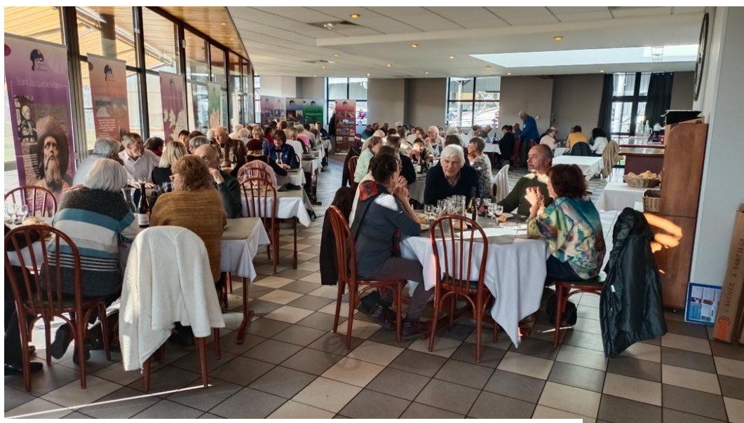
Assemblée plénière 2025 chez Vacavant