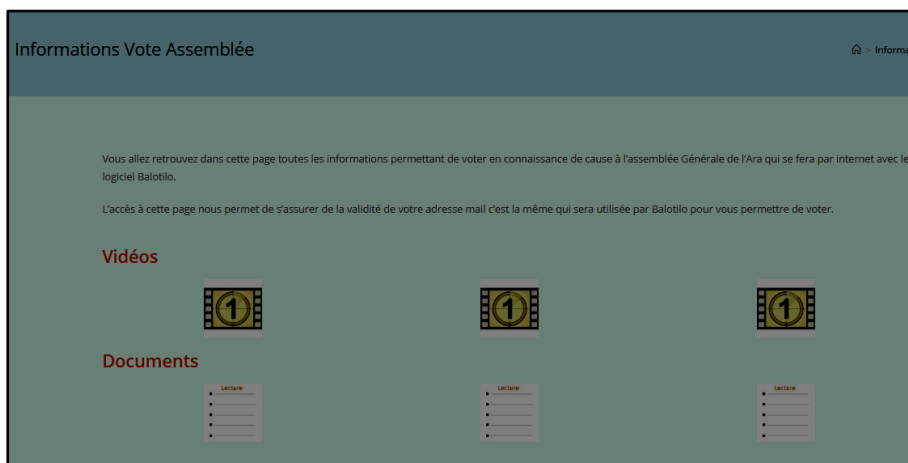
Informations Vote Assemblée

Ce lien vous envoie directement sur la page qui contient les documents.