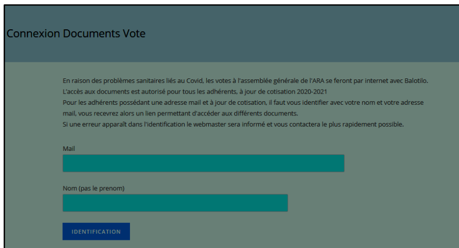
Connexion Documents Vote

https://portail-s.amis-st-jacques.org/connexion-adherent-vote/