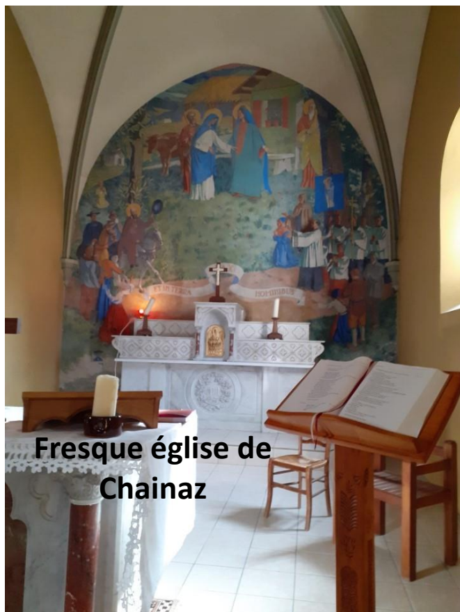
Fresque église de Chainaz