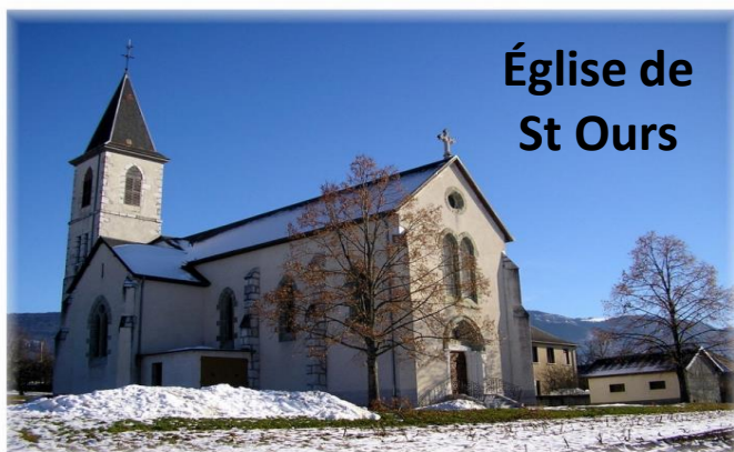
Église de St Ours