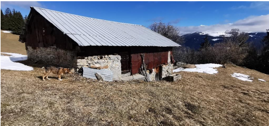
Le Plan, notre lieu de pique-nique