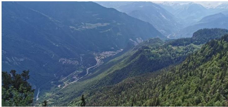
Vue sur la vallée vers Moutiers