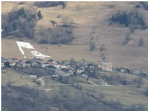
En gros ZOOM sur le versant en face ... le village de Notre Dame du Pré