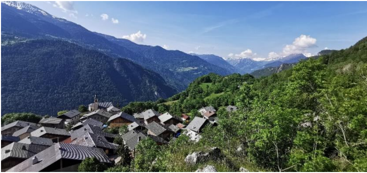
Les toits de Montgirod