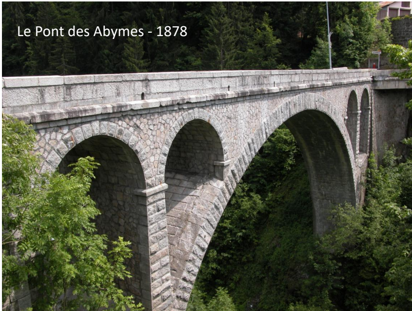
Le Pont des Abymes - 1878

Saint-Jacques, nous comptons sur toi pour avoir un temps splendide comme toujours !