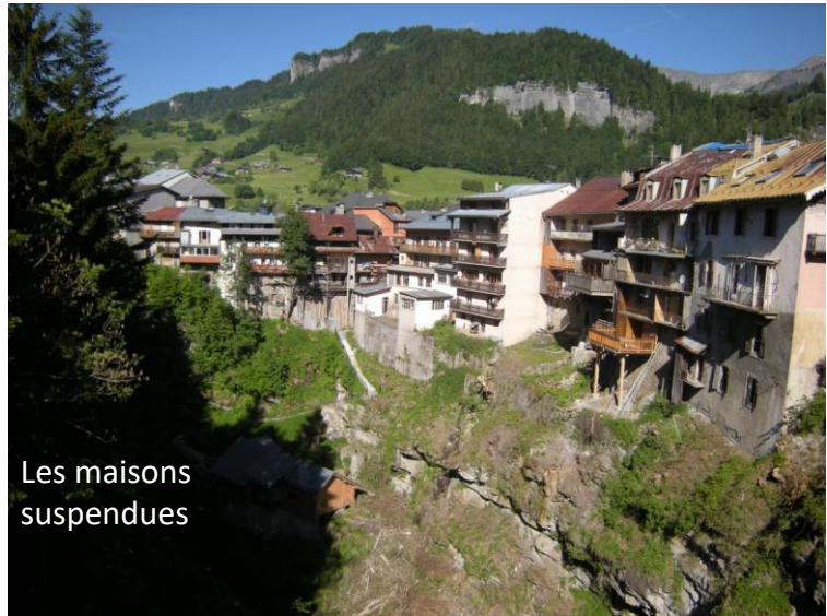
Les maisons suspendues