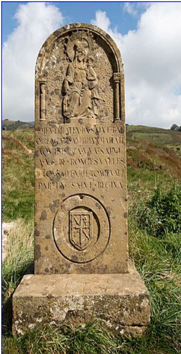
Stèle Col de Roncevaux