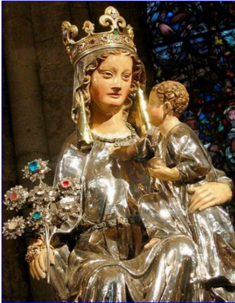
Collégiale: Statues de Notre Dame de Roncevaux et Saint Jacques