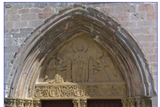
Tympan de L'Église Santa-Maria