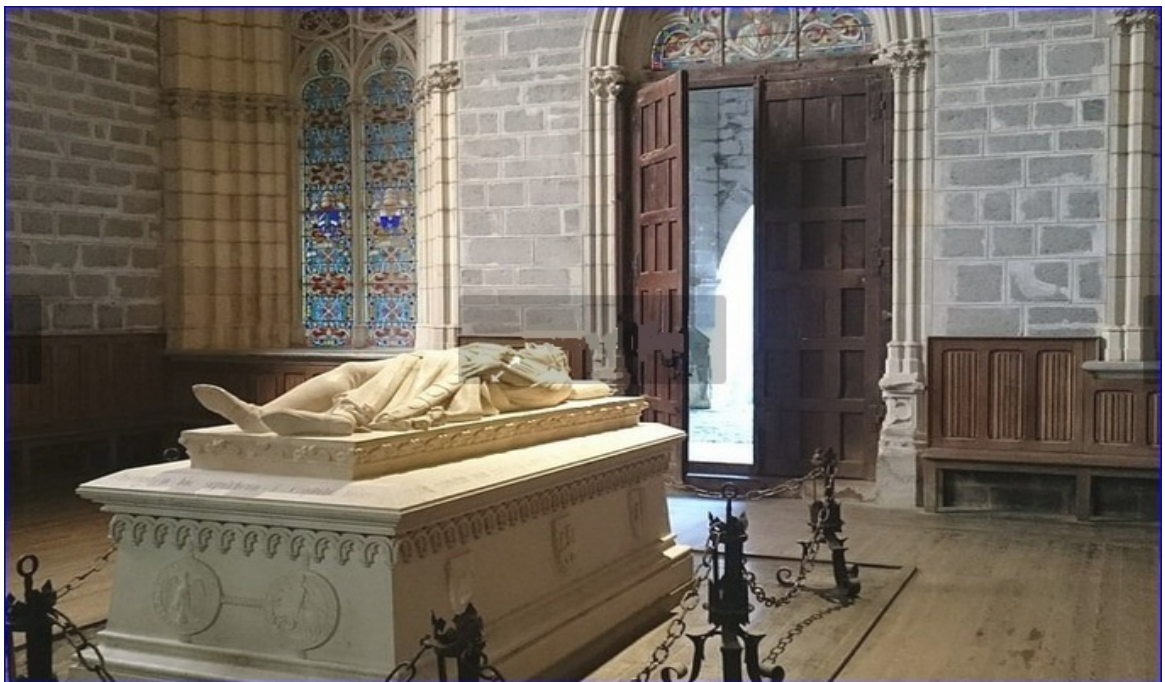
Chapelle St Augustin (Gisant de Sanche VII Le Fort )