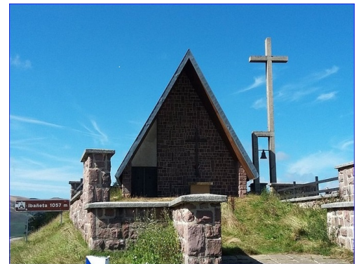
Chapelle Col d'Ibañeta