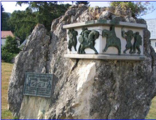
Monument érigé en commémoration des 1200 ans de la bataille de Roncevaux