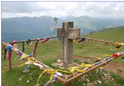
Orisson - La Croix Thibault

La Vierge de Biakorri (ou Vierge d'orisson) est également appelée Vierge des Bergers. Elle est située au pied de Château-Pignon, à 1055 m d'altitude. Presque à mi-distance de Roncevaux, au milieu des pâturages d'altitude, elle est le symbole des valeurs mariales liées à la Terre Mère, si puissantes au pays Basque.