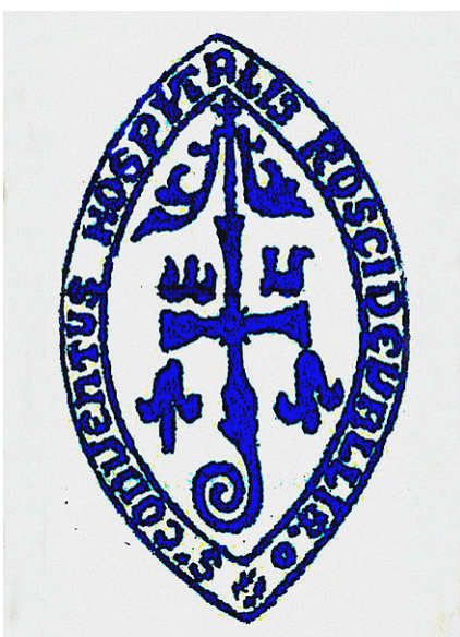
Cachet de la Collégiale

L'ensemble architectural d'Orreaga-Roncevaux est complété par la maison Itzandegia . Construite en style gothique naissant, elle fut hospice et habitation. Entre la Chapelle de Santiago et le centre Itzandegia, on peut apprécier le Monument à la Bataille de Roncevaux, dont les reliefs illustrent l'affrontement.