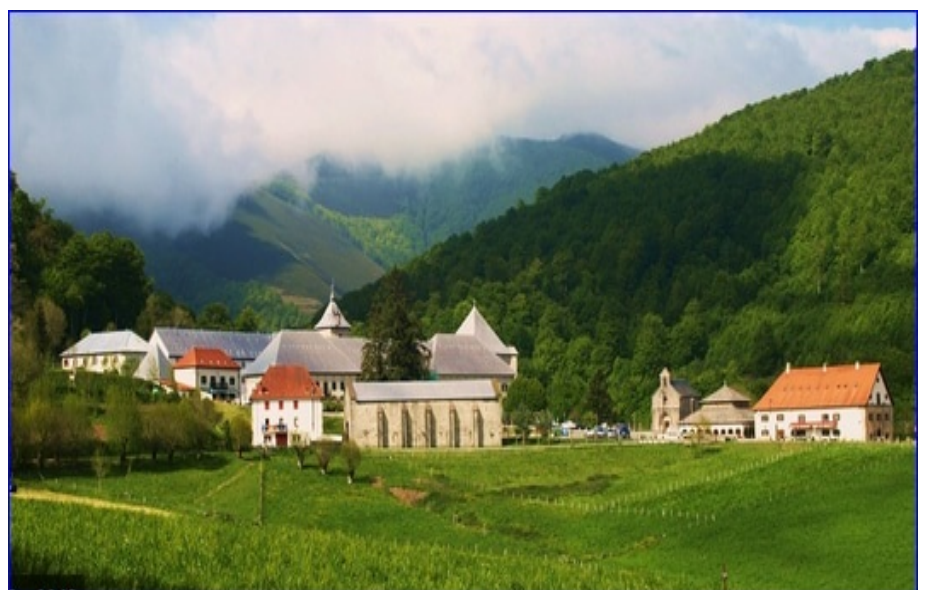
Collégiale de Roncevaux