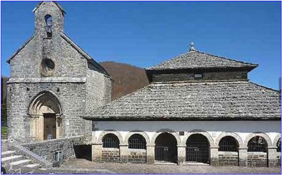
Chapelle St Jacques et Chapelle du St Esprit ( Silo de Charlemagne).