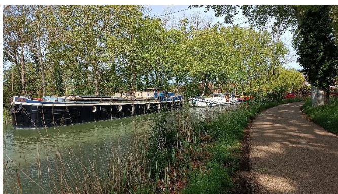
Le long du canal du midi avant d'arriver à Toulouse

Alain a cheminé sur la voie d'Arles, du Bousquet-d'Orb à Oloron-Sainte-Marie sur trois semaines. De la pluie, du vent, mais quelques belles journées également et un chemin magnifique avec les Pyrénées au loin.