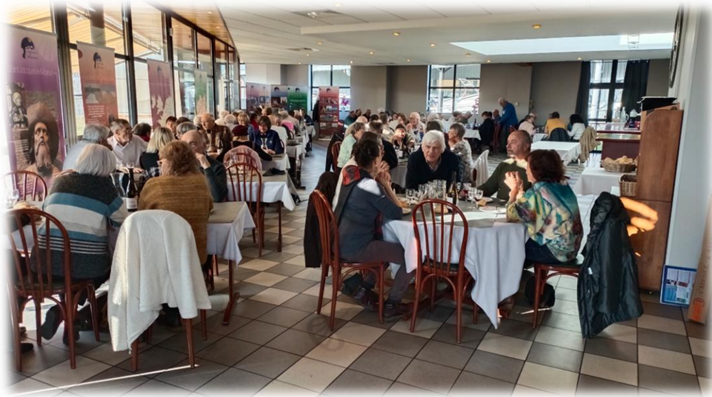
Assemblée plénière 2025 chez Vacavant