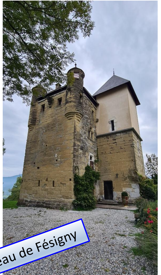
Château de Fésigny