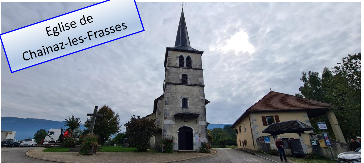
Eglise de Chainaz-les-Frasses