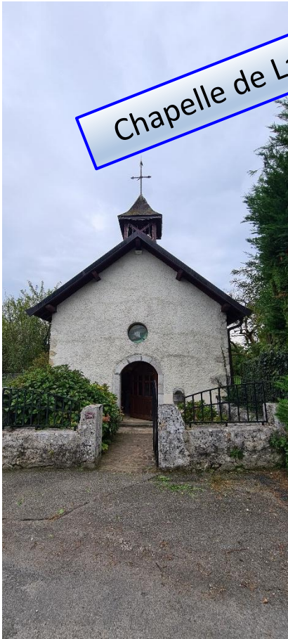
Chapelle de Lachat